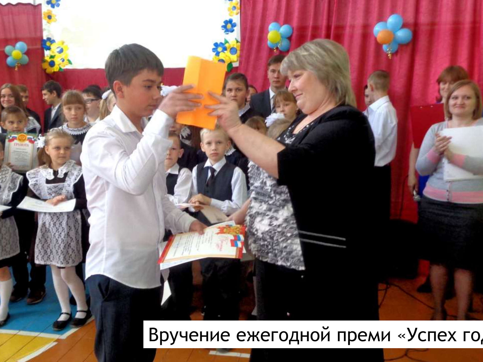
Вручение ежегодной премии «Успех года»