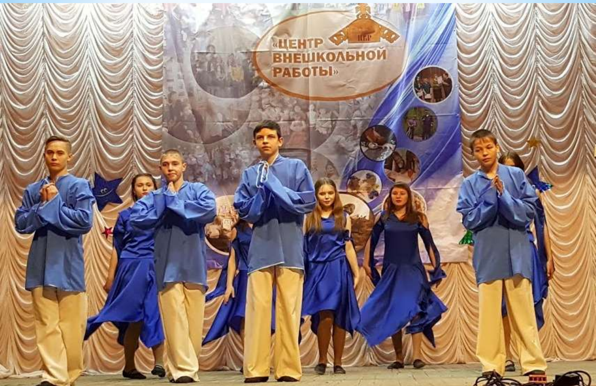
Танцевальный коллектив 8 класса- победитель районного эстетического фестиваля