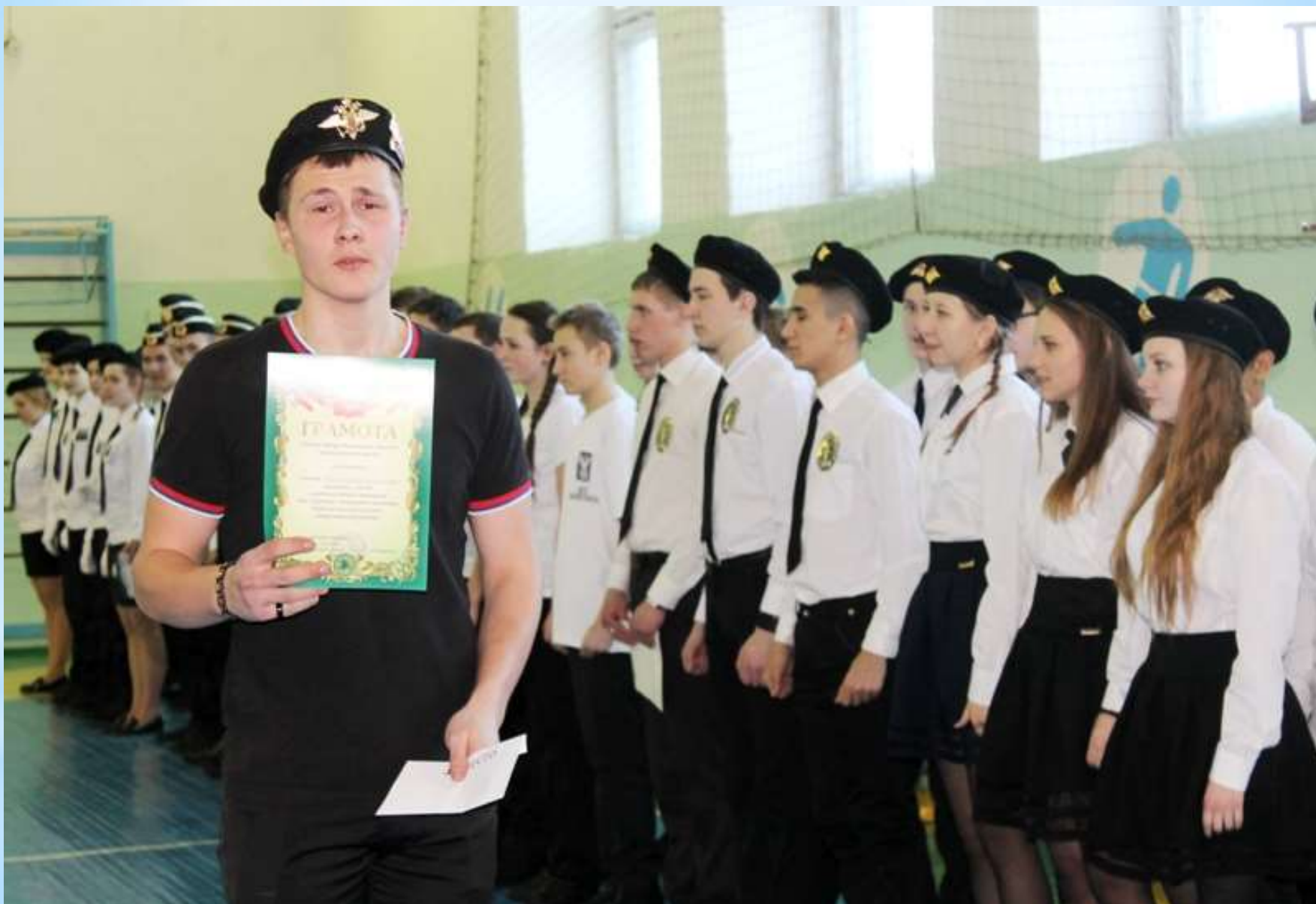
Районный конкурс «Зарница»