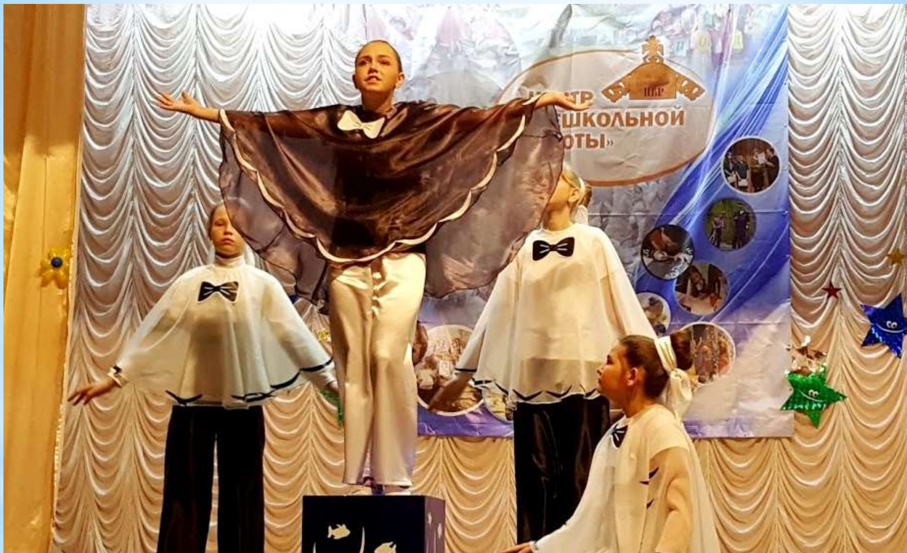
Экологический фестиваль «Природа глазами детей» Театральное объединение «Буратино»-лауреаты конкурса