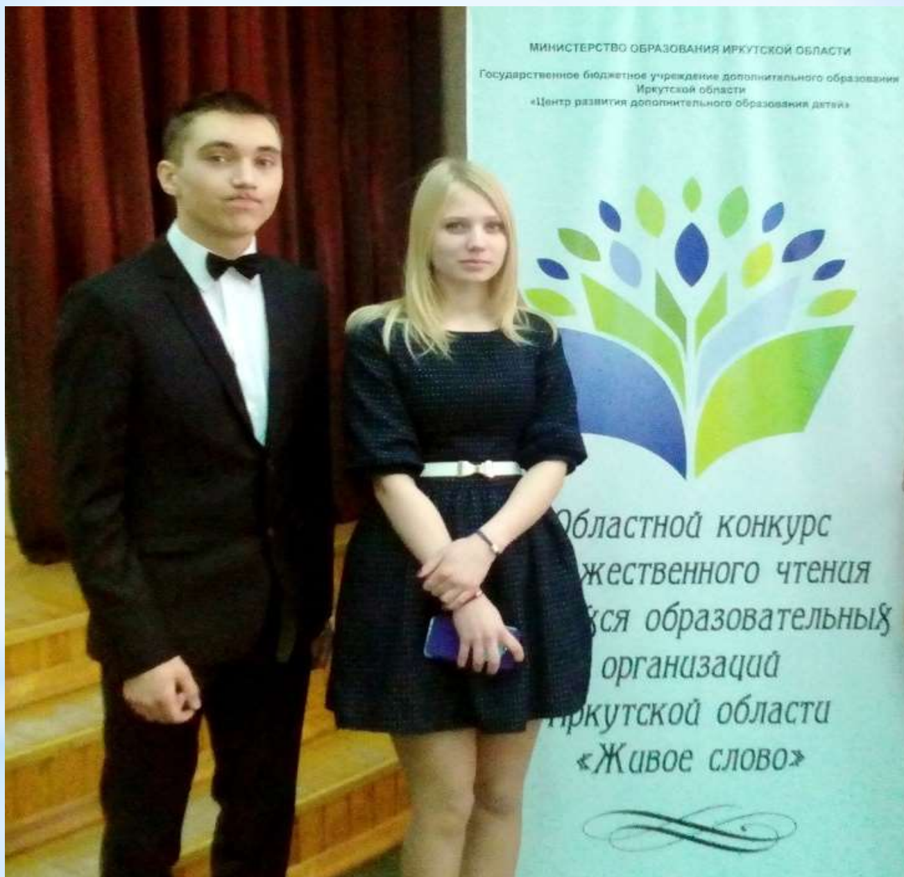
Областной конкурс художественного чтения «Живое слово»