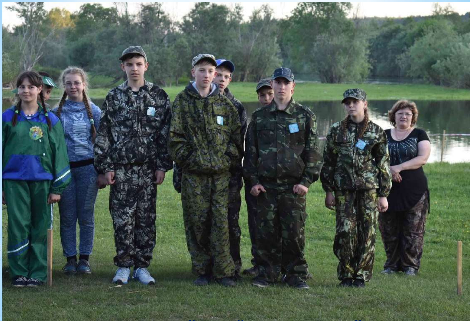
Районный туристический слет»